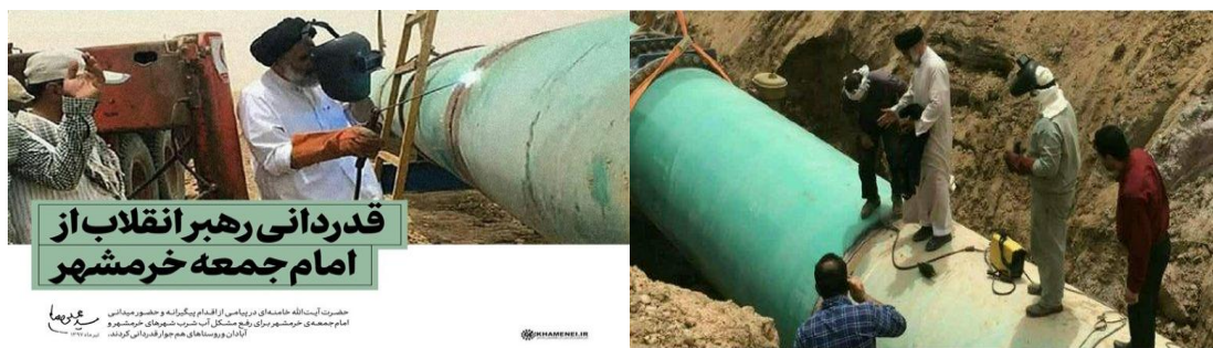
قدردانی رهبرانقلاب از امام جمعه خرمشهر

حاصل کلام اینکه: این همه آوازها از شه بود که امروز در کازیمای وجودی سید علی خامنه ای خود نمایی می کند که بر مسند امور نشسته اند و پیام پشت پیام صادر می نمایند و آخرین اش تشکر از مناعت طبع امام جمعه جوشکار خرمشهر که خواسته در هوای گرما جنوب با کارگران جوشکار لوله های آبرسان عکس یادگاری بیاندازد؛ ملاحظه بفرمائید: